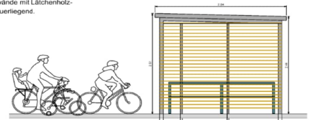
VORDERANSICHT M 1:20

Unterstand Stahlkonstruktion, verzinkt, Pulverbeschichtung RAL-Farbtone, Dach Trapezblech, 3 Seitenwände mit Lärchenholz- lattung, querliegend.